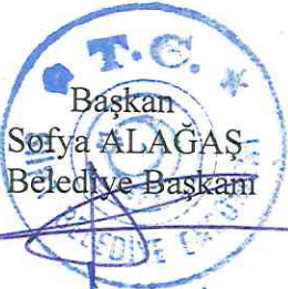
Başkan Sofya ALAĞAŞ Belediye Başkanı

Siirt İli Merkez Kooperatif Mahallesi 270 ada 3, 5, 6 ve 10 nolu parseller ile Evren Mahallesi 221 ada 2, 15 ve 16 nolu parseller ve 233 ada 4 nolu parselleri kapsayan alanda; 3194 sayılı imar kanununun 18. madde işi kapsamında, Bedeli uygulamaya girecek tapu malikleri tarafından verilmek üzere resen, Siirt Belediye Encümenininin 26.11.2024 tarih ve 17220518-302.03-101 karar numarası ile başlanmasına karar verilen 2024/-2 nolu düzenleme sahasında dağıtım işlemleri bitirilmiş olup, Kooperatif Mahallesi 270 ada 3, 5, 6 ve 10 nolu parseller ile Evren Mahallesi 221 ada 2, 15 ve 16 nolu parseller ve 233 ada 4 nolu parselleri kapsayan alanda, 3194 sayılı imar kanununun 18.maddesi (arazi ve arsa düzenlemesi) ve 7181 sayılı Tapu kanununu ve bazı kanunlarda değişiklik yapılmasına dair kanunun 9. Maddesine istinaden %38,13750 ile düzenleme ortaklık payının kamuya ayrılması ve imar uygulamasının onaylanması için encümen kararının alınması hususunu; Olurlarınıza arz ederim; gereği yapmak üzere karar örneğinin İmar ve şehircilik Müdürlüğüne tevdiine, Encümenimizce 31.12.2024 tarihinde oybirliğiyle karar verildi.